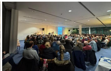
Israel- Event Januar 2026