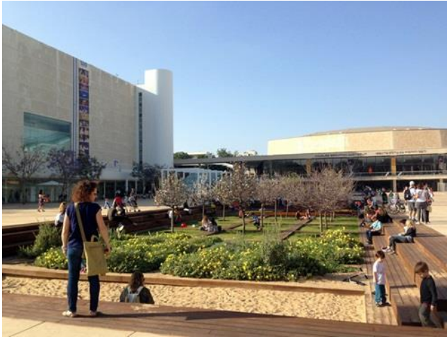
Der Habima Platz in Tel Aviv. Blühendes Leben da, wo vor noch rund 100 Jahren nur Sanddünen waren.

ursprüngliche Heimat zurück. Überall konnte man sehen, wie sich biblische Verheißungen erfüllten. (zum Beispiel Hesekiel 36, 35; Zacharia 8, 5; Jesaja 43, 5-7). Aus dem bettelarmen Agrarstaat wurde ein Land mit führender Technologie und einer starken Währung. Trotz ständiger Bedrohungen, Terror und trotz wiederholter Angriffe durch die arabischen Nachbarnationen gelang es Israel sich überzeugend zu behaupten. 2018, zu seinem 70 Jubiläum gehörte Israel zu den 10 einflussreichsten Ländern der Welt und lag auch im Happiness Ranking vorne.