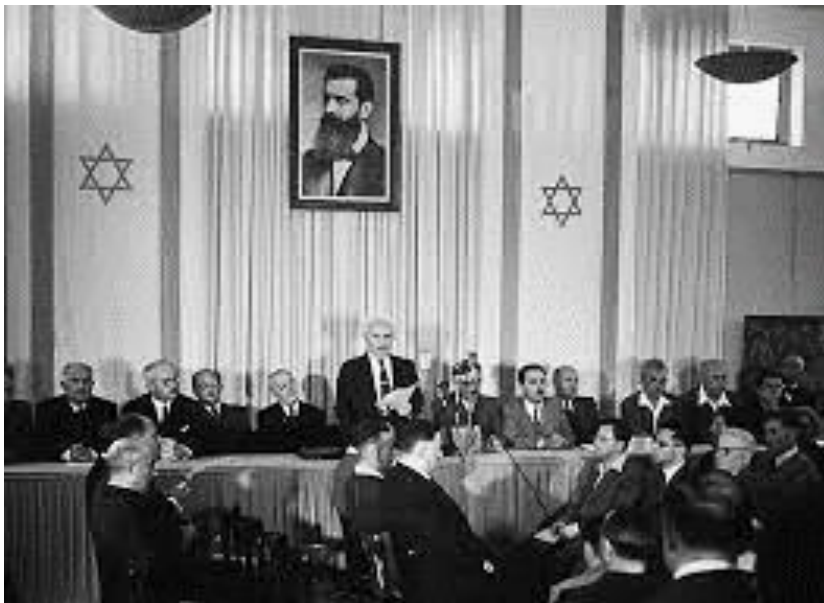
Die Proklamation des jüdischen Staates durch David Ben Gurion am 14. Mai 1948.

1948, nur drei Jahre nach dem Holocaust, erlebten die Juden ein weiteres, nationales Wunder: die Gründung des Staates Israel. Menschlich gesehen war dieses der unwahrscheinlichste Zeitpunkt. Das jüdische Volk war nur noch ein glimmender Docht im Sturm. Doch nach all den Jahrhunderten des scheinbar vergeblichen Kampfes um ein eigenes Land und nach der Vernichtung von sechs Millionen Juden, bekamen die Überlebenden diese unwahrscheinliche Chance.