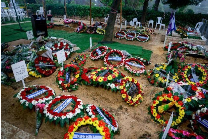
Der Friedhof in Jerusalem: Unzählige frische Gräber nach dem Massaker vom 7. Oktober 2023.

Und wie vor über zweitausend Jahren witterten Israels Feinde angesichts dieser internen Zwistigkeiten ihre Chance und schlugen am 7. Oktober 2023 zu. Seit den Massenmorden des Holocausts sind nicht mehr so viele Juden an einem Tag getötet worden. Und selten ist in der Weltgeschichte ein Massaker mit so viel Bestialität durchgeführt worden. Alte, Junge, Männer, Frauen, Kinder. Von der Hamas misshandelt, verstümmelt, vergewaltigt, verbrannt, gefoltert, entführt.