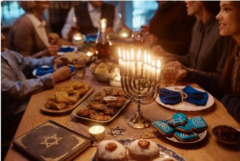
Chanukka Feiern wurden zu heimatlichen Lichtbringern und Hoffnungsträgern.

In den darauffolgenden zahlreichen Auswanderungswellen, der so genannten jüdischen Diaspora, verstreuten sich die Juden über die ganze Welt. Ihre Riten und Bräuche nahmen sie mit und so begannen in der Fremde bald erste Chanukkafeiern.