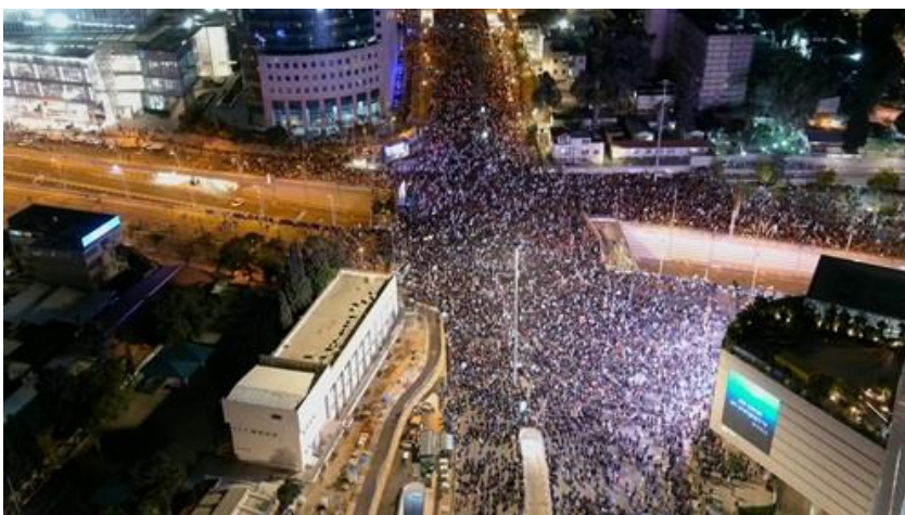
Proteste und Demonstrationen legten 2023 das halbe Land lahm.

Doch die Nachkommen der Gründergenerationen schienen sich nicht mehr so bewusst zu sein, wie ihre Vorväter, dass die Existenz ihres Landes ein Wunder war. Fremde Einflüsse faszinierten viele. Und langsam, aber unaufhaltsam, driftete die israelische Bevölkerung auseinander. Hier die säkularen Liberalen, dort die ultraorthodoxen Juden. Die einen, die Israel mit den Arabern teilen wollten und die anderen, die versuchten, neue jüdische Siedlungen in Judäa und Samaria zu gründen. Die mit einer internationalen und die mit einer nationalen Ausrichtung. Die linken und die rechten, die fortschrittlichen und die konservativen. Seit April 2019 gab es in 4 Jahren 4 Parlamentswahlen. Die Koalitionen zerbrachen an Uneinigkeit. Proteste, die sich vordergründig gegen eine geplante Justizreform, aber letztendlich gegen die Regierung selber bildeten, erschütterten Israel und legten 2023 teilweise das halbe Land lahm.