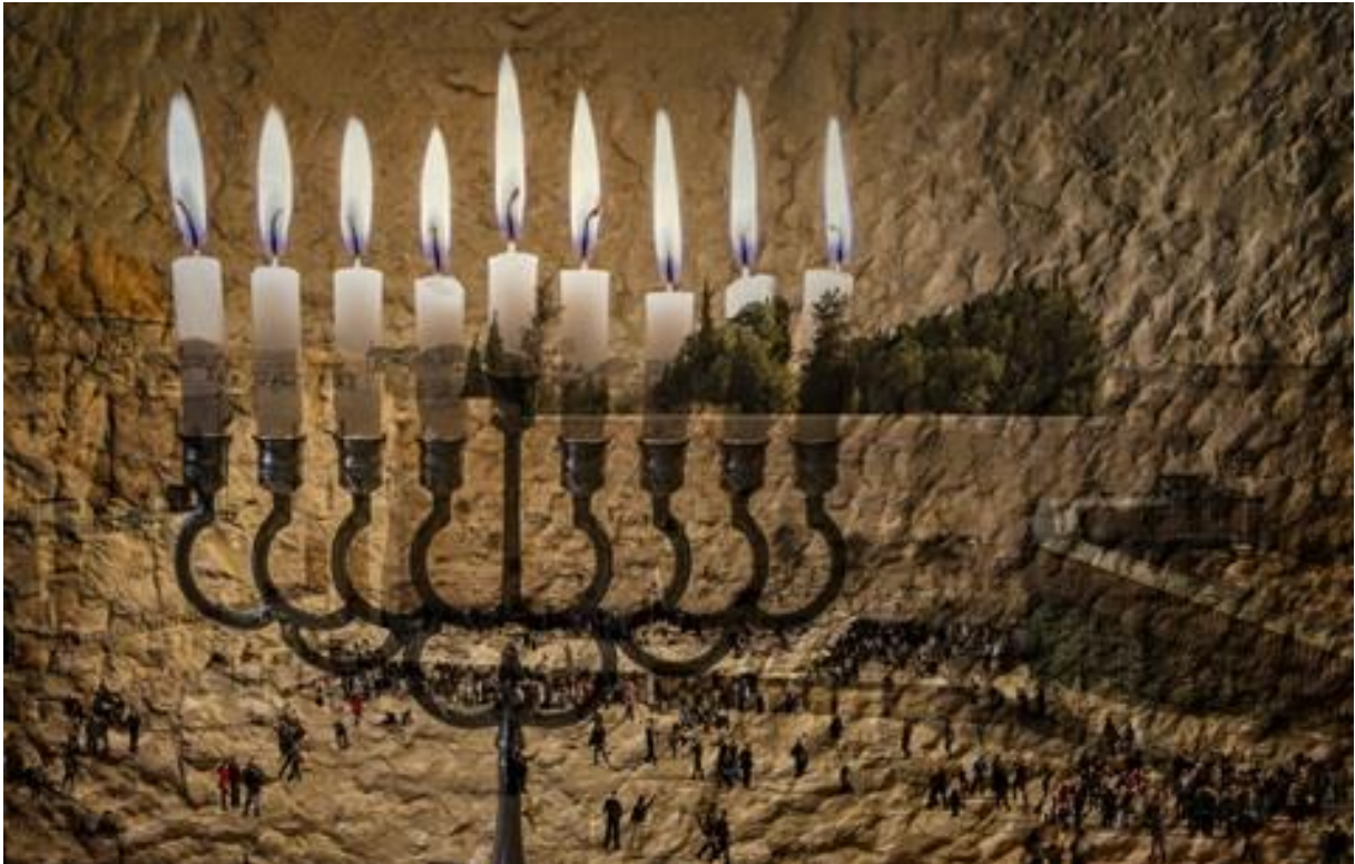
Ein fast zweitausend Jahre altes Fest der Hoffnung.

Die Geschichte von Licht in der Dunkelheit, von dem Triumph einer Minderheit und von Wundern gegen jede Wahrscheinlichkeit.